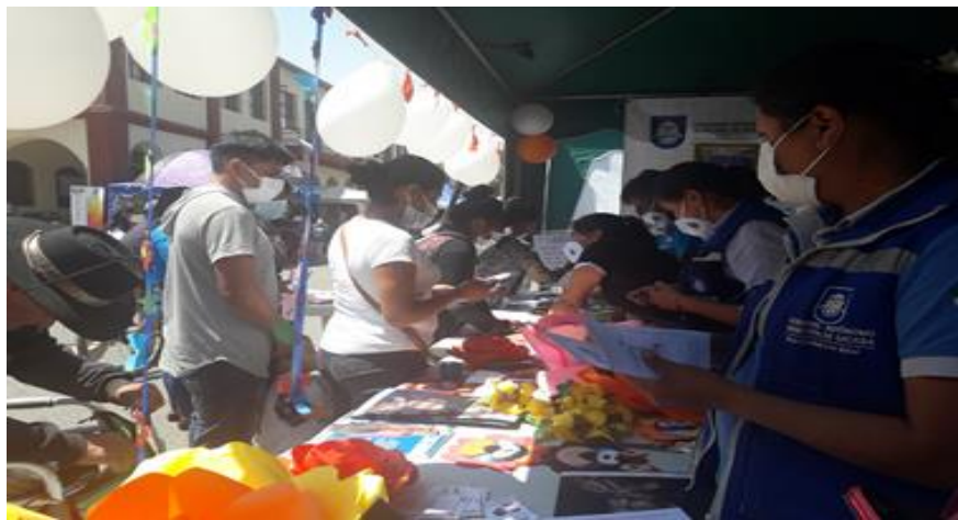
3. Feria de prevención por el Día de la no Violencia y el Maltrato hacia víctimas de Violencia Distrito 1 (25/11/2021)