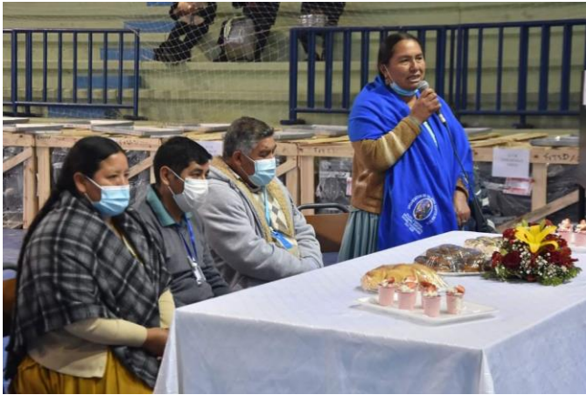
1. Acto de entrega de equipamiento del reformulado de presupuesto D-4