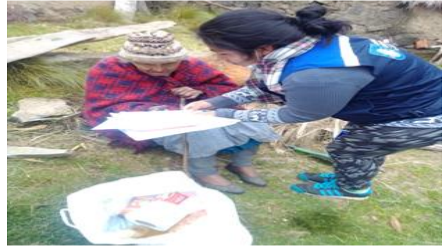
2. Apoyo con donación de alimentos durante la cuarentena Distrito Palca (17/04/2020)