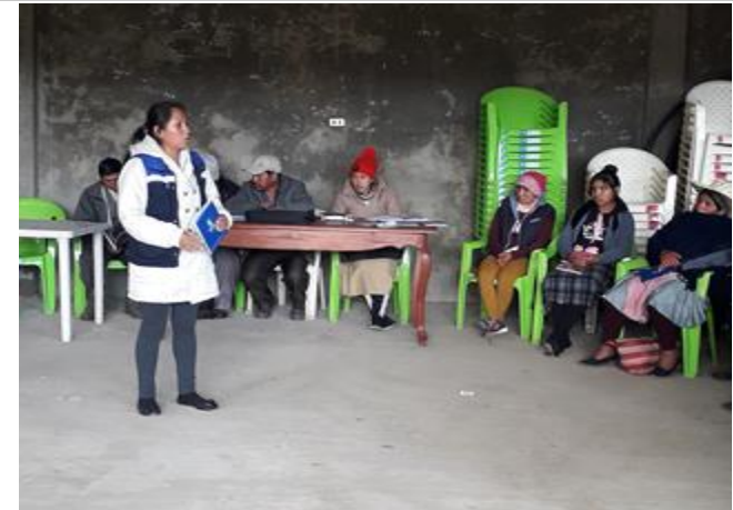
3. Taller preventivo Derechos de las personas Adultas Mayores Distrito Aguirre (15/02/2020)