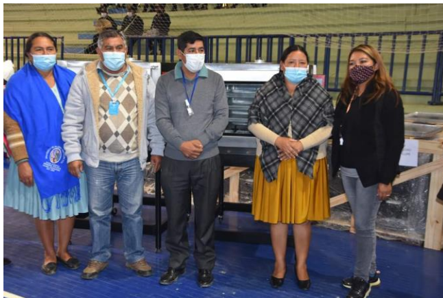
3. Entrega de equipamiento D-4