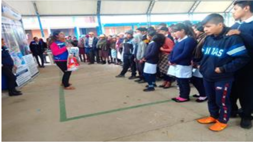
1. Feria informativa Derechos y Deberes de las personas Adultas Mayores Distrito Aguirre 2 (18/02/2020)