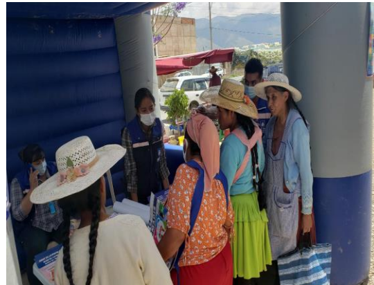
5. Atención a la población en los diferentes distritos.