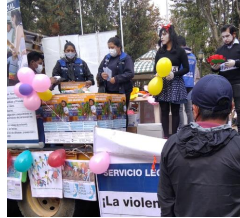
2. caravana de la no violencia