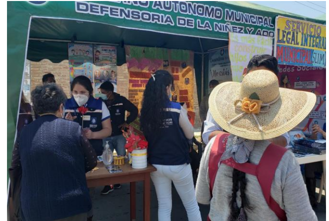
7. Actividades de prevención en los diferentes Distritos