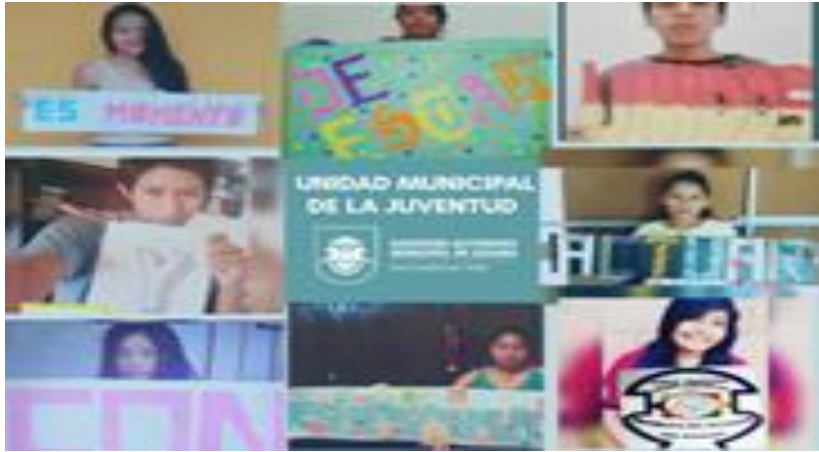
1. Prevención de violencia mediante redes sociales durante la cuarentena. (20/04/20)