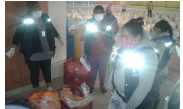
3. se realizó el apoyo con el armado de las canastas familiares