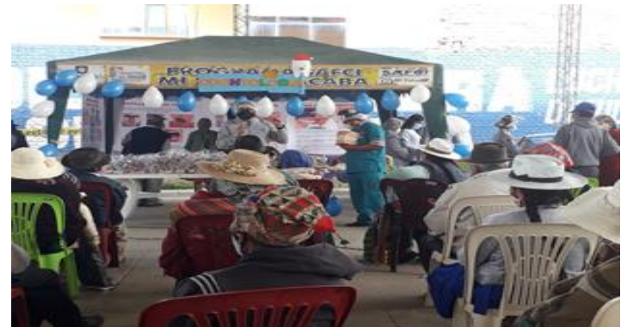
4. Taller de capacitación en salud para personas Adultas Mayores Distrito 1 (16/12/2020)