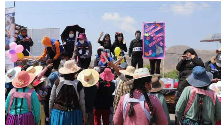
6. Caravana de la no violencia «Respetar y hacer que respeten tus Derechos»