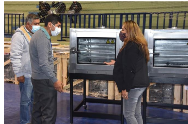
4. Entrega de equipamiento D-4