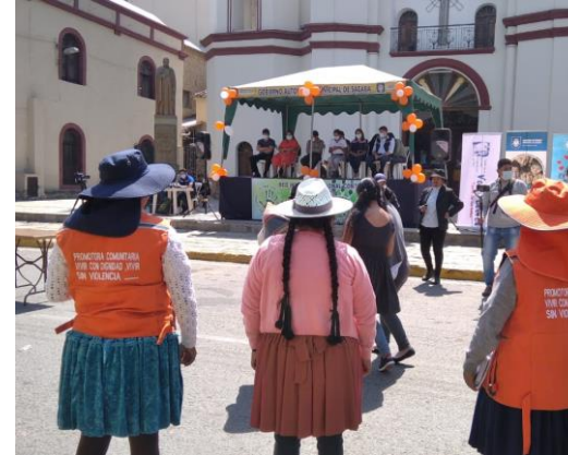
4. feria del día de la no violencia