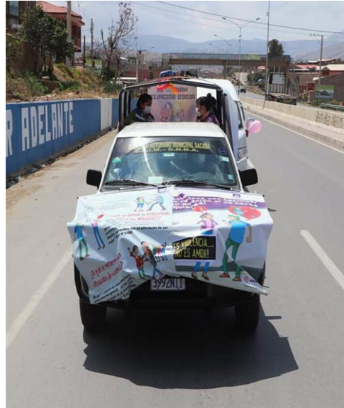
6. Caravana de la no violencia recorriendo por las diferentes zonas de nuestro Municipio.