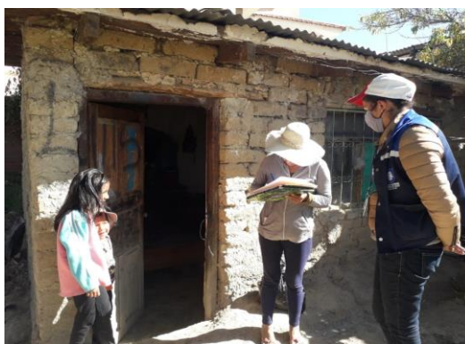
4. Visitas de Seguimiento realizado en los diferente distritos