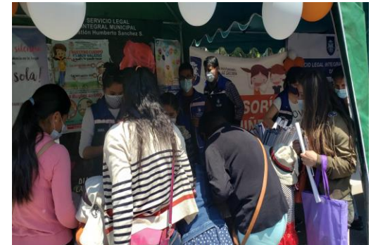
7. Actividades de prevención en los diferentes distritos