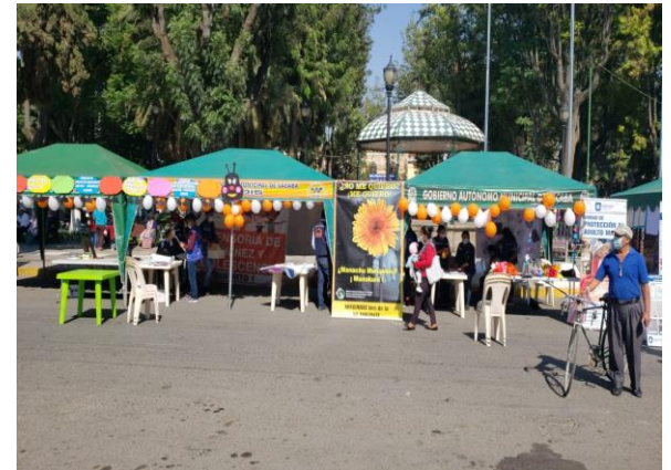
5. Atención a la población en los diferentes distritos.