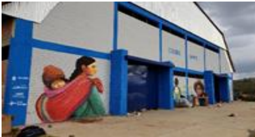
3. Pintado de murales relativos a la prevención de embarazo adolescente (22/10/20)