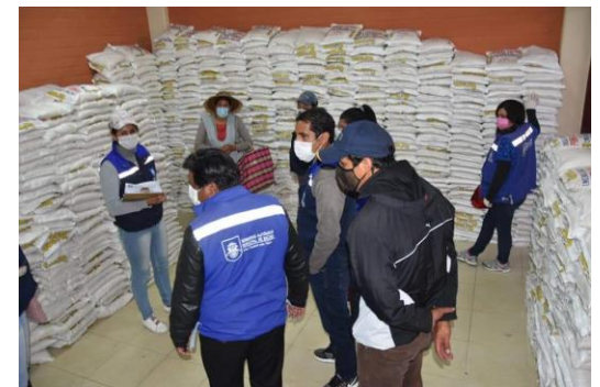
3. Armado de canastas familiares