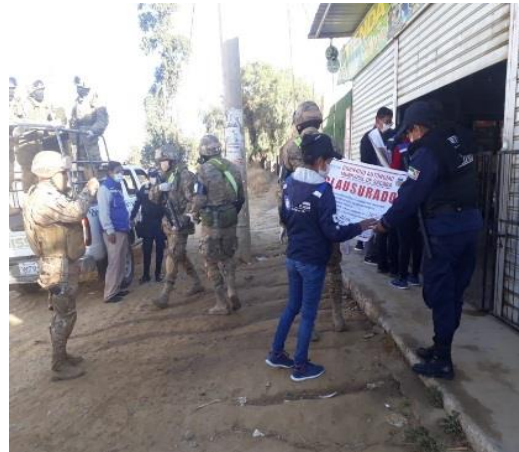
2. Operativos de control en los diferentes Distritos