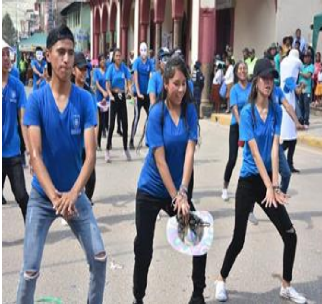
1. Campaña de prevención de embarazo adolescente y transmisión de ITs por temporada de carnavales. (08/03/20)