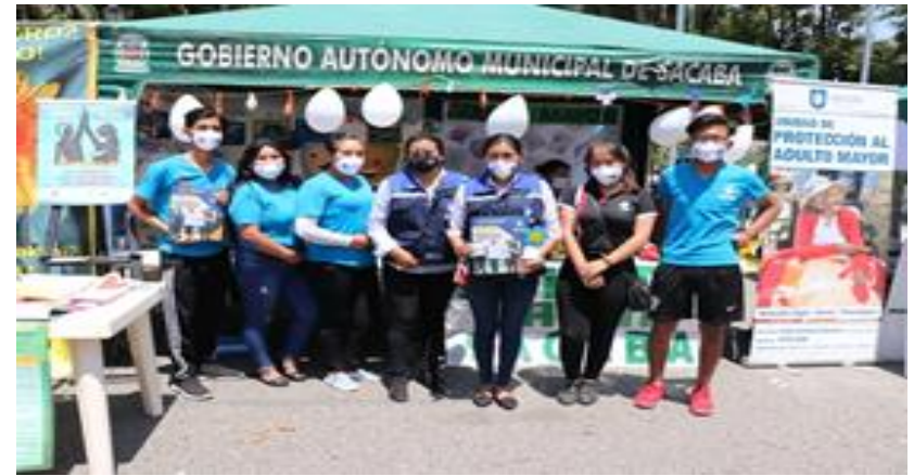
4. Orientación vocacional mediante el uso de una Aplicación (6/12/20)