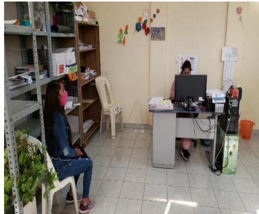
3. Atención a la población en los diferentes distritos.