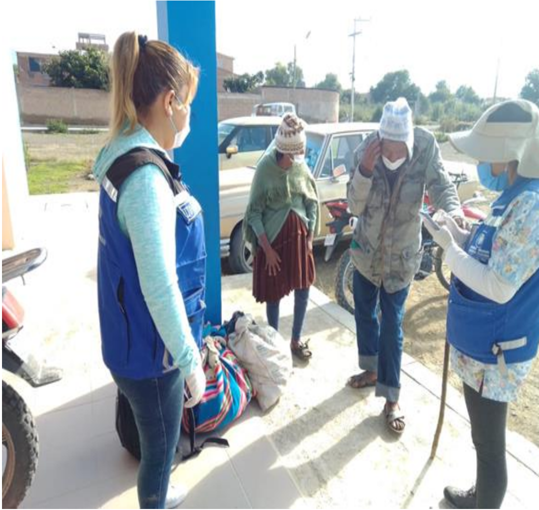
1. Apoyo con traslado a otro Distrito y/Municipio durante la cuarentena (Vinto 08/04/2020)