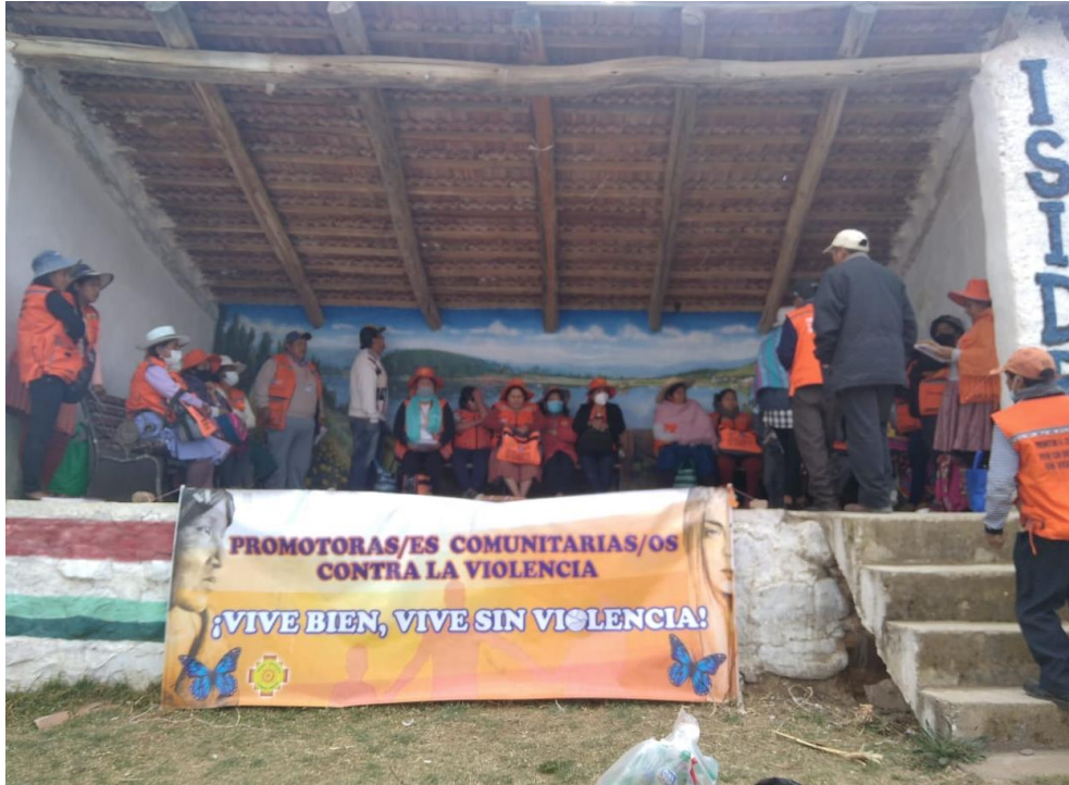
1. taller con promotoras comunitarias