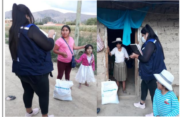
2. Gestiones Sociales que se realizó durante la cuarentena para ayudar a las mujeres de escasos recursos