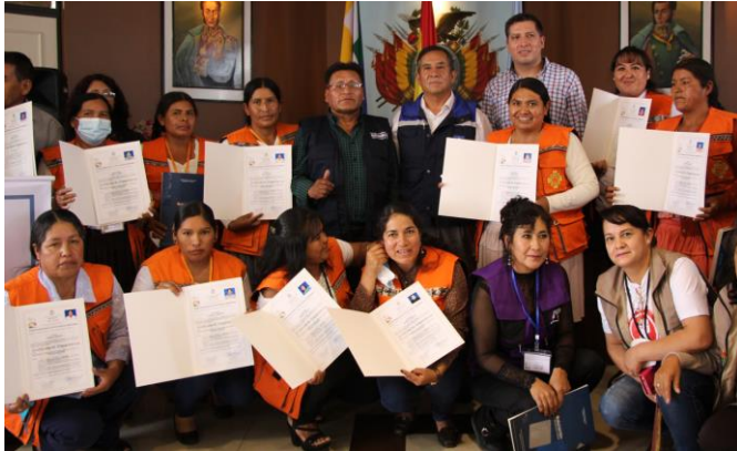
3. graduación y entrega de certificación de promotoras comunitarias a nivel nacional