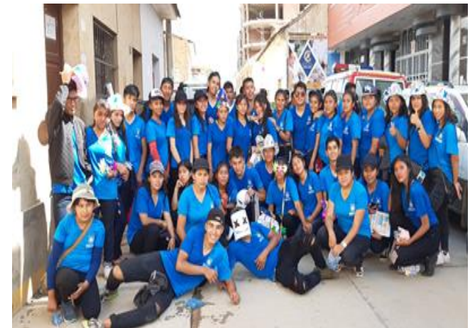
3. Participación en el curso de cursos Sacabeño (08/03/20)