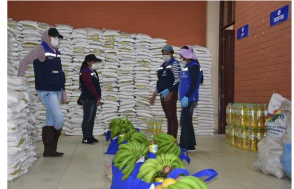
2. Armado de canastas familiares