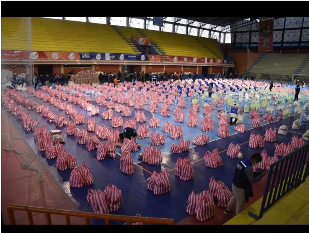
1. Armado de canastas familiares