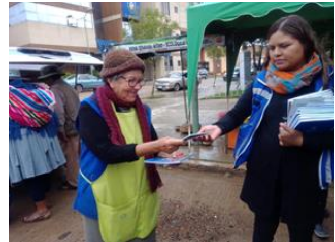
2. Taller informativo Socialización de la Ley No. 369 Distrito 7 (31/01/2020)