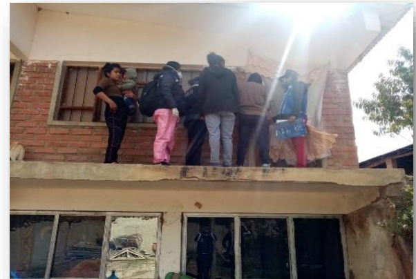
4. Visitas de Seguimiento realizado en los diferente distritos