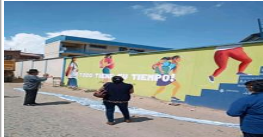
2. Pintado de murales relativos a la prevención de embarazo adolescente (19/10/20)