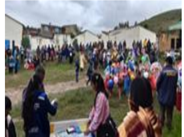
2. Carnaval en el distrito rural Ucuchi (15/02/20)