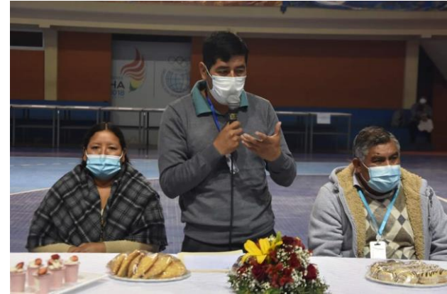
2. Entrega de equipamiento D-4